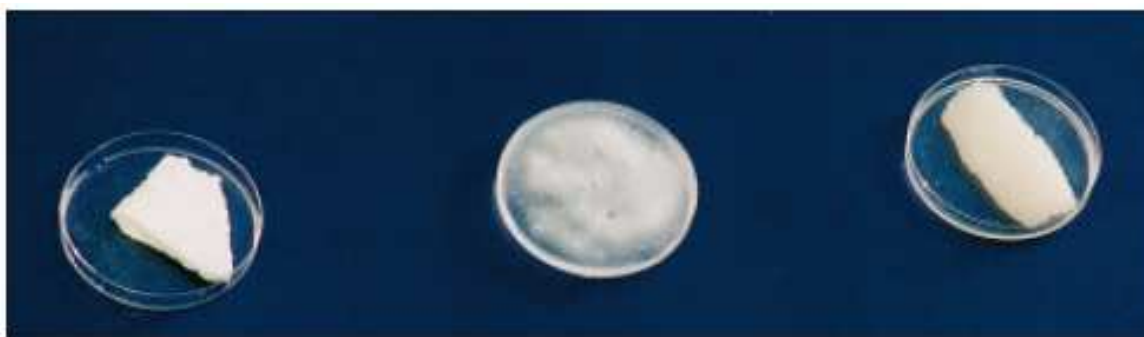
Crusta de polimer

Cea mai buna solutie este de a lasa polimerul sa se umfle (de la o ora la o zi) si de a-l inlatura prin raclare in ziua urmatoare.