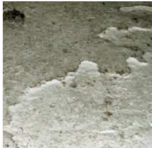
Crusta uscata si compacta de polimer

Cand se prepara pudra de polimer, unele cantitati pot fi imprastiate pe sol si pe utilaje. Prin absorbtia umiditatii din aer se formeaza mase compacte, deseori dificil de inlaturat. Odata cu trecerea timpului, crustele devin din ce in ce mai dure, mai compacte si mai greu de indepartat.